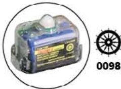
Luz Intermitente de Colete Salva-Vidas "Safelite" Ativada por Água. Código 333170