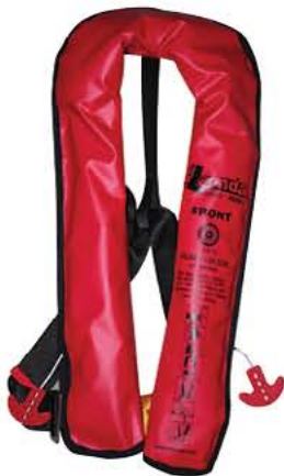
Colete Salva-Vidas Lamda Auto 150N, SOLAS Código 333100

Os coletes salva-vidas infláveis 150N Lalizas SOLAS cumprem com as mais recentes especificações SOLAS para segurança ideal a bordo. Eles apresentam câmaras duplas para segurança dobrada. Cada câmara pode ser inflada pela cabeça operacional automática Lalizas, certificada de acordo com a ISO 12402-7 ou manualmente e suporta um tubo de inflação oral incorporando as válvulas de alívio de pressão Lalizas, certificadas de acordo com a ISO 12402-7. O balão inflável, fabricado com tecido amarelo de alta visibilidade, é dobrado em uma valise de nylon com fechamento de Velcro e também é equipado com fitas refletoras Lalizas e apito, certificado de acordo com a ISO 1202-7 e 8, sendo que o Safelite de luz aprovado pela Lalizas pode ser adicionado. Os coletes salva-vidas são fáceis de usar e oferecem segurança máxima graças à sua rápida inflação mesmo a temperaturas baixas. Seu design leve os torna ideais para uso em barcos de passageiros, navios comerciais, iates, pesqueiros e em todas as embarcações com espaço de armazenamento limitado. Os coletes salva-vidas infláveis SOLAS Lalizas estão disponíveis em tamanho adulto e em 2 tipos diferentes de revestimento; valise padrão e pochete. Ambos os coletes salva-vidas são apropriados para passageiros com o tamanho do tórax maior do que 175 cm e passageiros com excesso de tamanho. São confeccionados com uma alça de elevação para facilitar o resgate.