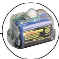
Luz Intermitente de Colete Salva-Vidas "Safelite" Ativada por Água. Código 333170