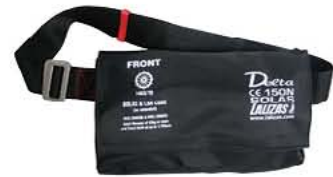
Pochete do Colete Salva-Vidas, Delta Auto 150N, SOLAS Código 333104