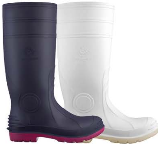
C.A. 11865 Tech Master 12048 Tech Master com Biqueira 11864 Tech Master com Biqueira e Palmilha